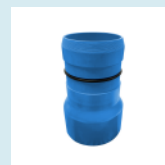
TERMINAL LAY FLAT A PEGAR