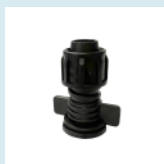
CONECTOR CINTA LAY FLAT 16MM