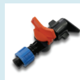
CONECTOR CINTA LAY FLAT CON MINI VÁLVULA