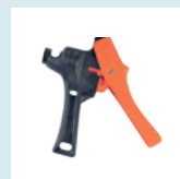
PERFORADOR TIPO PISTOLA 14 MM LAY FLAT