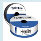
CINTA DE RIEGO DE PARED DELGADA 6 MIL A 10, 6 MIL A 15 6 MIL A 20 Y 8 MIL A 10