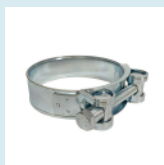
ABRAZADERA ALTA PRESIÓN 3", 4", 6" y 8"